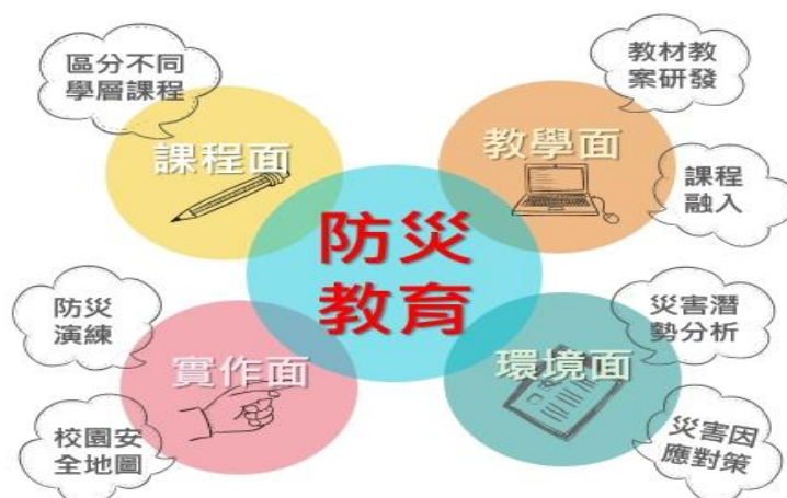
圖 1 防災教育計畫目標