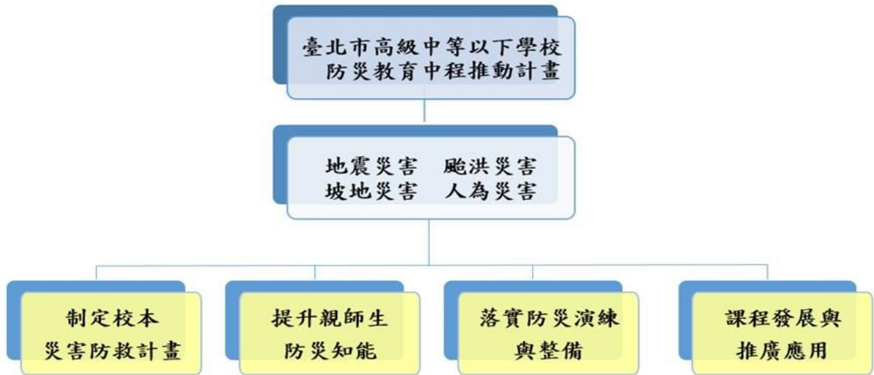
圖 7 臺北市政府教育局高級中等以下學校「防災教育中程實施計畫」114-116 年中程計畫架構