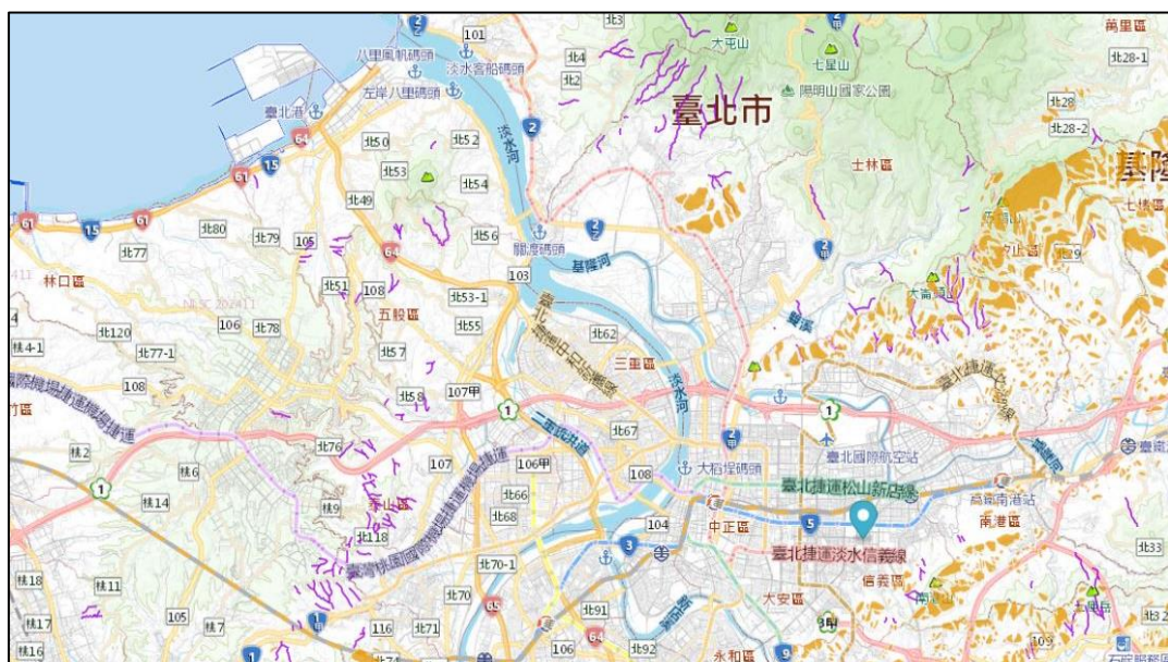
圖5 臺北市土石流及順向坡災害潛勢地圖

本市市中心區域位於臺北盆地底部，大屯火山群位於市區北邊與新北市接壤處，整個山系於市區內大致向南延伸並趨緩，直抵圓山、大直與內湖等地，是臺北市境內最大的山系；最高的七星山為 1,120 公尺，次高的大屯山為 1,092 公尺，山系中心地帶與北投側的外緣地帶有不少火山地形。市區東邊的內湖、南港與南邊的木柵多為丘陵地形；標高約 300 多公尺的南港山系則橫互於信義、南港兩區之間。坡地災害範圍廣泛，包含土石流、山崩、地滑及順向坡所引起之災害等，其主要受山地坡度、水、地震及人為影響，本市為盆地地形，四周為山地，常遭遇颱風、暴雨等侵襲，易造成土石流之發生(如圖 5)。